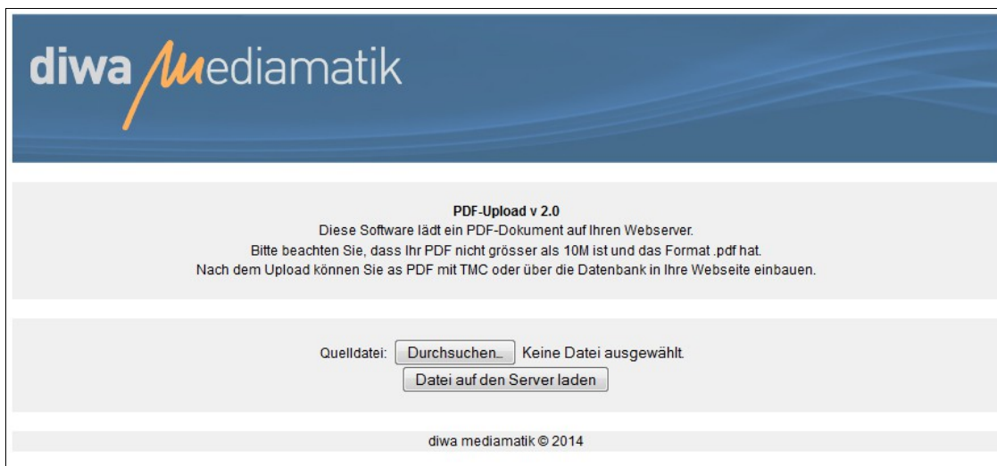
Bild1: Bedienoberfläche PDF Upload App