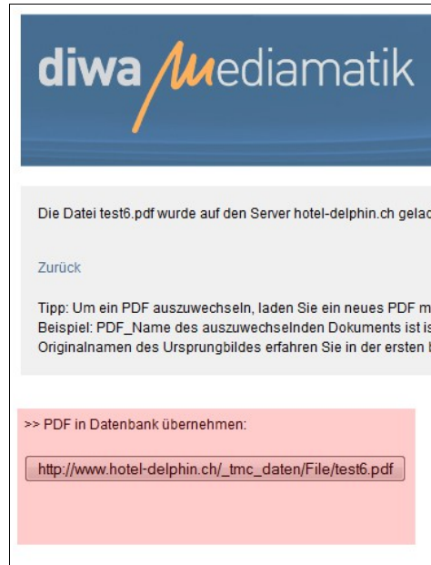
Bild5: Mit Klick auf Taste (hier test6.pdf) Wird die Datei in das Datenbank- System eingetragen und somit übernommen.